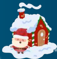
La Maison du Père Noël du 14 au 24 décembre