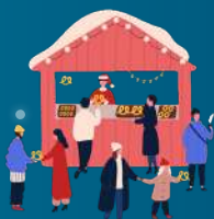
Le marché de Noël