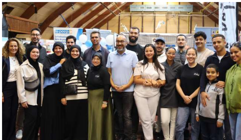
Lors du forum des associations 2024

Eurêka, c'est également un Mois de l'orientation, organisé chaque année afin d'aider les jeunes à définir leurs ambitions professionnelles. L'événement se clôture systématiquement par un forum Orient'Action organisé au gymnase Nelson Mandela leur permettant de rencontrer des professionnels. La dernière édition a permis à l'association d'accompagner 1 200 jeunes. Le prochain forum d'orientation se déroulera le 1er février 2025, avec pour ambition de faire aussi bien. Les membres sont également présents lors des manifestations municipales, telles que la Semaine de la Santé ou celle de l'Écologie.