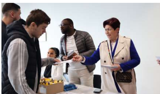
Cérémonie de remise des cartes électorales aux primo-votants, le samedi 4 mai 2024

Tout commence dès votre emménagement à Goussainville. Que vous vous soyez fait connaître directement auprès des services de la ville ou lors des échanges avec les élus, l'occasion de découvrir la commune et ses élus vous est proposée dans le cadre d'une matinée d'échanges. Organisé cette année le 21 septembre, ce petit-déjeuner a permis aux nouveaux arrivants de se familiariser avec Goussainville et de discuter librement avec élus et cadres de la Mairie.