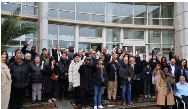
Cérémonie des médaillés du travail, le samedi 23 novembre 2024

Des rendez-vous pour tous, appréciés et surtout valorisants dans sa vie d'habitant et de citoyen.