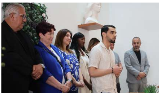
Cérémonie des nouveaux naturalisés, le samedi 29 juin 2024

Nous avons tous une occasion de franchir les portes d'une Mairie mais il est toujours agréable d'y être invité pour célébrer une étape importante dans une vie. Depuis quelques années, l'équipe municipale a mis un point d'honneur à célébrer comme il se doit ses nouveaux habitants, nouveaux électeurs, récents naturalisés ou médaillés du travail.