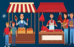
Des chalets de restauration