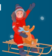
Une piste de luge deux couloirs