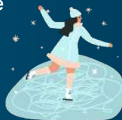
Une patinoire de 300 m2