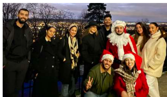
Lors de l'évènement Noël pour tous