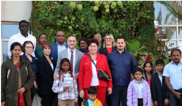
Cérémonie d'accueil des nouveaux habitants de Goussainville, le samedi 21 septembre 2024

Enfin, pour couvrir un large spectre de la vie locale, les médaillés du travail sont mis à l'honneur à l'occasion d'une cérémonie dédiée. Souvent oublié dans le cadre professionnel, ce moment marquant dans la vie d'un salarié est célébré à Goussainville. Argent, vermeil, or ou grand-or, toutes les carrières sont récompensées et un diplôme honorifique est remis aux récipiendaires.